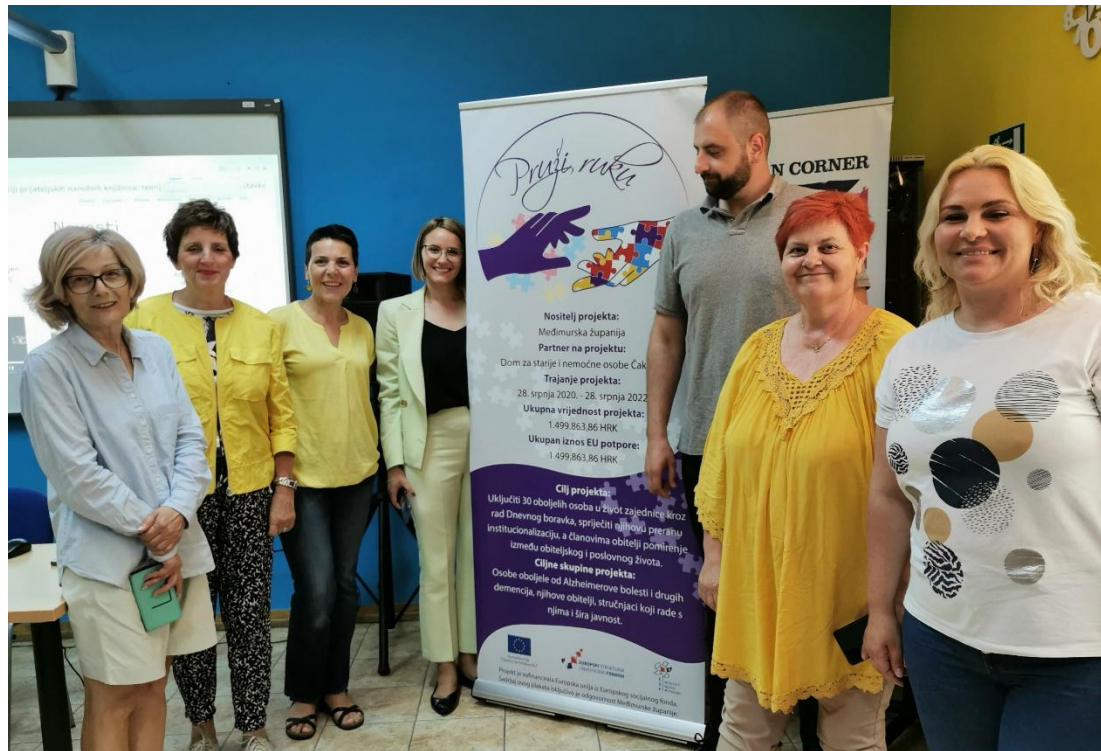
Alzheimer Cafe u GISKO-u