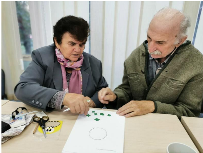
Radionice s umirovljenicima